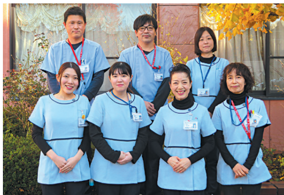
患者支援センターのスタッフ