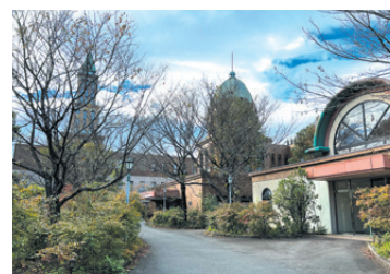
介護老人保健施設「カワムラコート」