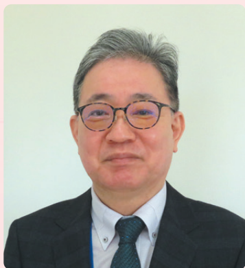
医療法人社団 カワムラヤスオメディカルソサエティ 河村病院